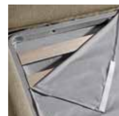
COPRIRETE BED BASE COVER