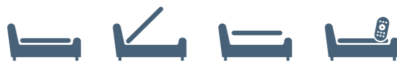
EASY CASE CASE X2 MATIC CASE