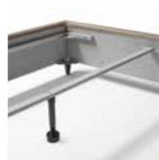
SUPPORTO RETI SINGOLE BAR FOR SINGLE BED FRAMES