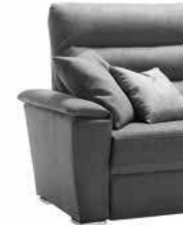
PIEDE OPTIONAL ART. SUL H. 4 cm wengé e cromo

VERSIONE IN PELLE LEATHER VERSION VERSION EN CUIR