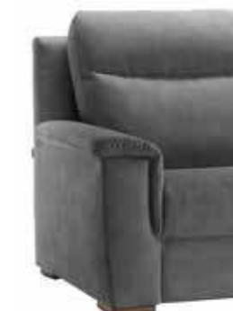
PIEDE OPTIONAL ART. CA 137 H. 3,5 cm legno noce