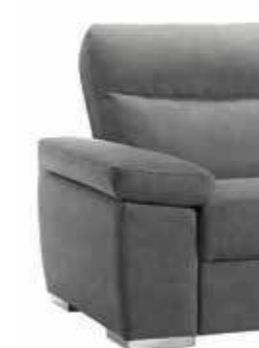
PIEDE OPTIONAL ART. CA560 H. 4 cm metallo cromo lucido