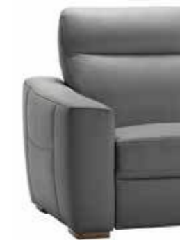
PIEDE OPTIONAL ART. CA 137 H. 3,5 cm legno noce