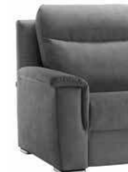
PIEDE OPTIONAL ART. P503NEP503 H. 3 cm wengé e cromo