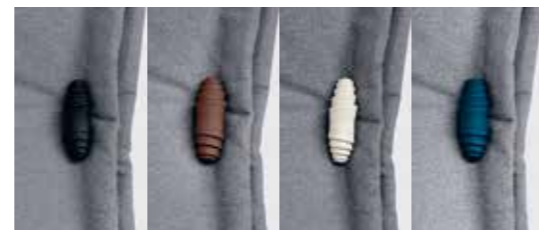
POSSIBILITÀ DI SCEGLIERE IL COLORE DELL'ALAMARO NERO • CIOCCOLATO • NEVE • BLUETTE IT IS POSSIBLE TO SELECT THE COLOUR OF THE TOGGLES BLACK • CHOCOLATE • SNOW • BRIGHT BLUE