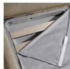
COPRIRETE BED BASE COVER