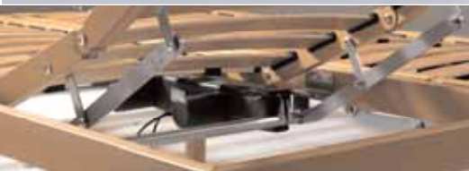
Movimento a diverse combinazioni